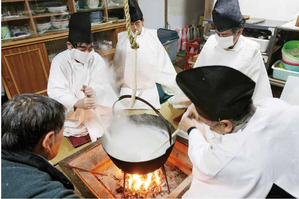
粥の中に葦を入れかきまぜる様子

毎年1月14日の夜から15日未明にかけて、飽富神社で氏子達が、米・麦・粟・稗等9種類の農作物の豊凶を占う年中行事です。米粉を溶いた粥 かゆ の中に束ねた葦 よし を入れ、葦の中に入る粥の量で豊凶を占います。いろりの鉤と箸の用意や米粉の用意などの役割が家ごとに定まっており、年占いの古い形を残す貴重な行事です。